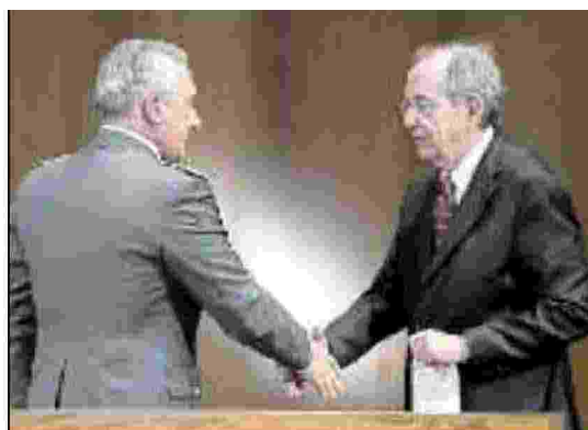
L'INAUGURAZIONE DELL'ANNO ACCADEMICO Il ministro Pier Carlo Padoan saluta il gen. Giorgio Toschi, comandante della Guardia di Finanza

L'età minima per andare in pensione con 35 anni di contributi